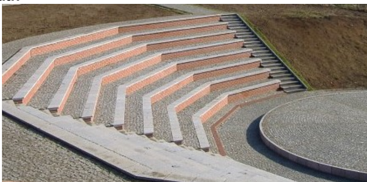
Przykładowy mini amfiteatr wybudowany na zboczu skarpy (Przemyśl).

Mini amfiteatr z miejscami siedzącymi dla około 250 osób, zlokalizowany na zboczu wyprofilowanej skarpy, ma umożliwić organizowanie w ładnej scenerii (nad brzegiem jeziora) kameralnych koncertów, przedstawień teatralnych, występów kabaretowych czy też występów okolicznościowych. Tarasy widowni oraz scena zaprojektowane zostaną w sposób harmonijnie komponujący obiekt z otoczeniem (kamienne okładziny tarasów-widowni, drewniana scena ze składanym płóciennym zadaszaniem w kształcie żagla, na skarpach skalniaki, wokół sceny nasadzenia zieleni ozdobnej).