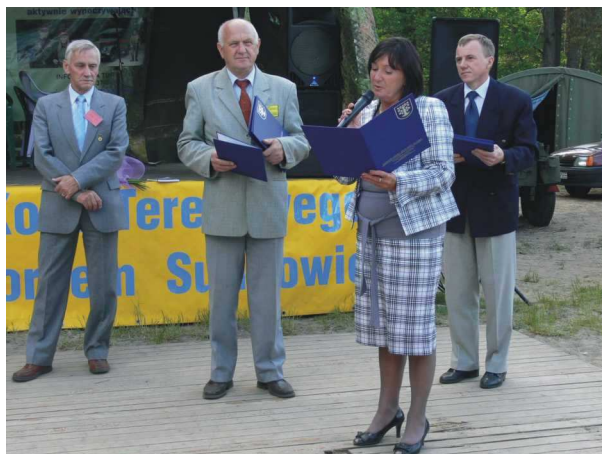
XV-lecie – władze Miasta i Gminy wręczają gratulacje za działalność Koła