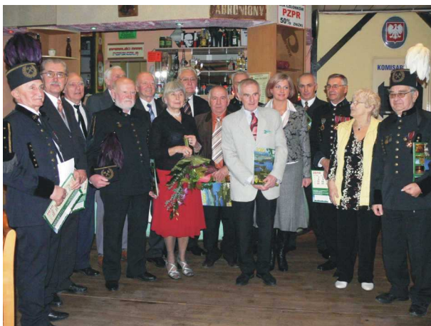
„Barbórka” uhonorowanie górników emerytów